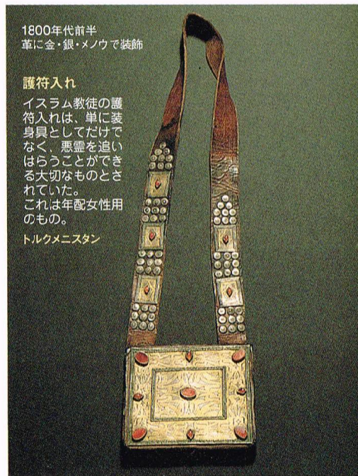
1800年代前半 革に金・銀・メノウで装飾

プチポワンとは『小さな点』の意で大変緻密な刺繍が施された芸術品のこと。用途にあわせ注文で刺繍し、貴族はバッグにもプチポワンを使用した。